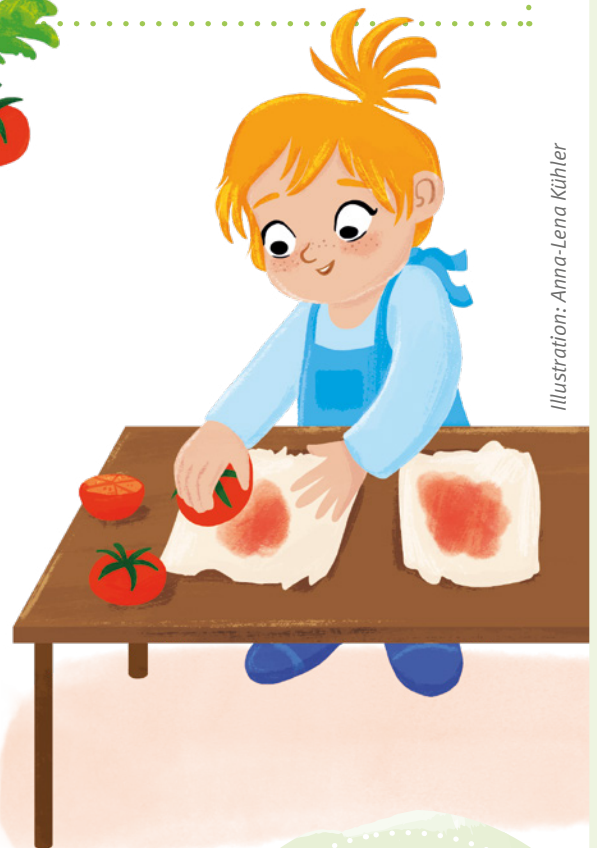
Illustration: Anna-Lena Kühler